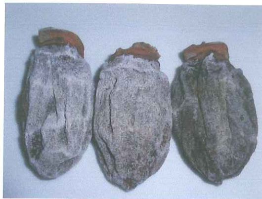
<保存しておいた干し柿>